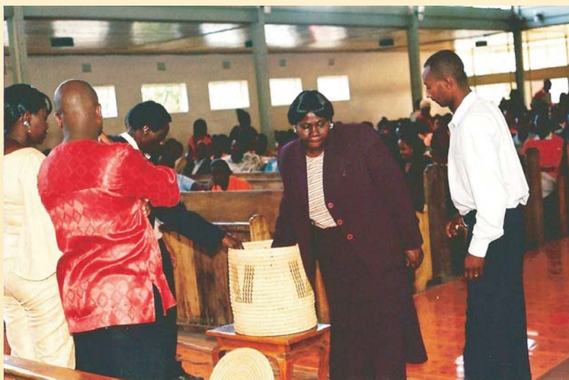
La congrégation de la Cathédrale de Nakuru faisant une offrande pour la Campagne pour la dignité de l'Afrique