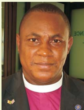
Evêque Dibo Thomas-Babyngton Elango

J'ai pris mes fonctions le 13 avril 2008. Je remercie Dieu pour cette formation car elle répond à nos préoccupations en tant que dirigeants d'église.