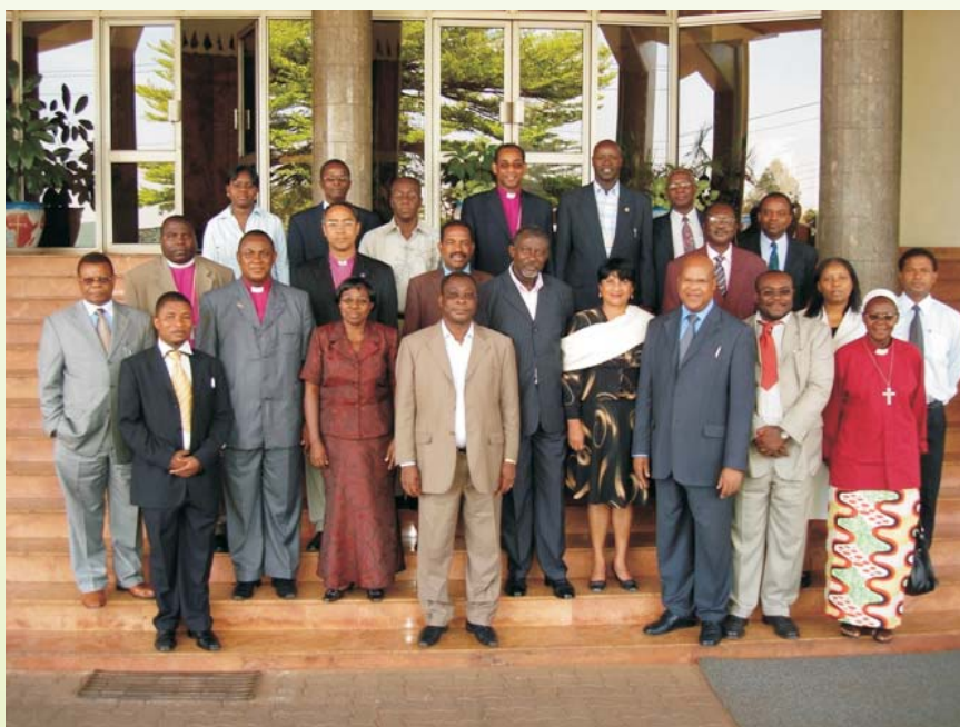
Les Chefs d'église qui ont participé à l'atelier sur le changement climatique avec certains membres du personnel de la CETA.

Le changement climatique est un défi majeur pour notre époque. Sur la base des textes de la Bible, en particulier le livre de la Genèse, et se situant dans une perspective géostratégique (à la lecture de la géostratégie), les chefs d'église du Cameroun, de la République Centrafricaine, du Togo, du Burundi, du Rwanda, de Madagascar et du Zimbabwe se sont engagés à être des agents de changement dans leurs pays. Ces chefs d'église ont exprimé l'espoir que le séminaire les équipe en faits scientifiques qui les aideront à comprendre les causes profondes ainsi que les conséquences du changement climatique. Ils ont lancé un appel aux églises et aux fidèles pour 'empower' les populations et les soutenir dans leurs efforts pour s'opposer à une destruction irresponsable de l'environnement, à la surexploitation des ressources naturelles par une petite minorité de gens. Dieu nous confié un rôle de 'gestionnaire' de Sa création pas pour l'égoïsme des générations riches et présentes. Dans son plan d'amour pour nous, Son fils Jésus