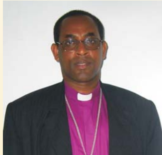
Evêque Eraste Bigirimana

J'ai été élu à mon nouveau poste en novembre 2005. Le cours d'orientation m'a beaucoup inspiré. J'ai beaucoup appris surtout à propos des fonctions d'un leader d'Eglise. J'en ai profité pour mieux connaître la CETA. Le cours est approprié pour mes nouvelles fonctions.