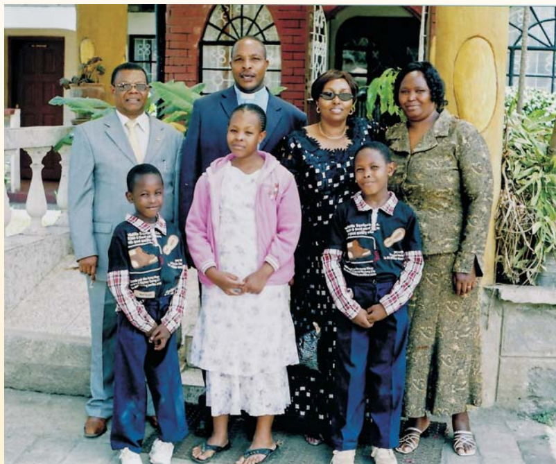
Le Secrétaire du Diocèse et sa famille avec le personnel de la CETA à Nakuru

secrétariat de la CETA qu'un appel a été lancé aux fidèles pour contribuer financièrement au